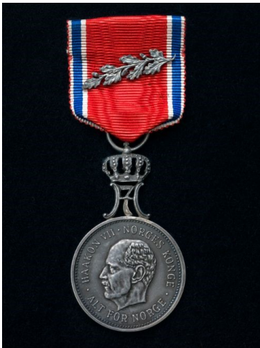
St. Olavsmedaljen m/ekegren